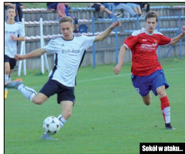
Sokół w ataku...

Po przerwie taktyka drużyny z Szamocina nie ulega zmianie - ciągłe ataki powodują, że Polonistom pozostało tylko się bronić. W 78 minucie Ja-