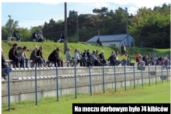
Na meczu derbowym było 74 kibiców

W ostatnią sobotę nasze drużyny rozegrały ciekawe mecze piłkarskie, w tym jeden mecz derbowy pomiędzy Sokółem Szamocin a Polonią Chodzież.