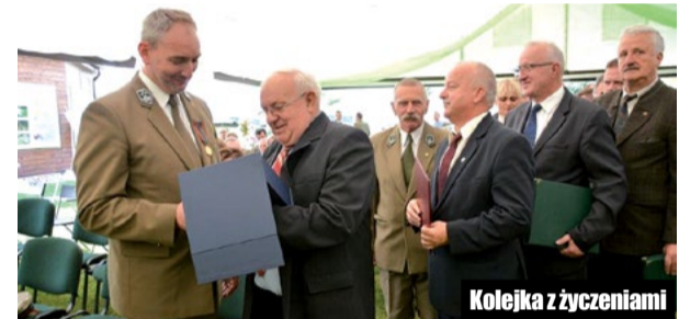
Kolejka z życzeniami