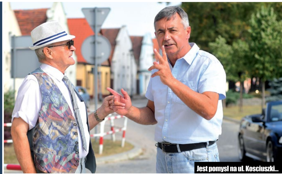
Jest pomysł na ul. Kosciuszki...

W moim programie dla mieszkańców zaprojektowanym na lata 2018-2028, chciałbym określić kierunki działania w tej ważnej materii, którymi będę konsekwentnie podążał. W naszej koncepcji obie te dziedziny nawzajem się uzupełniają stąd trudno je rozdzielać. Obecnie turystyka to nie tylko aktywny wypoczynek, rekreacja, nieskażone środowisko, ale to również walory historyczne i kulturalne miasta.