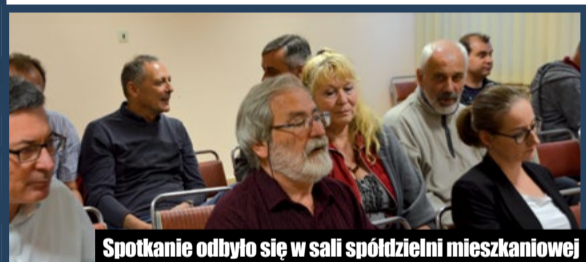
Spotkanie odbyło się w sali spółdzielni mieszkaniowej