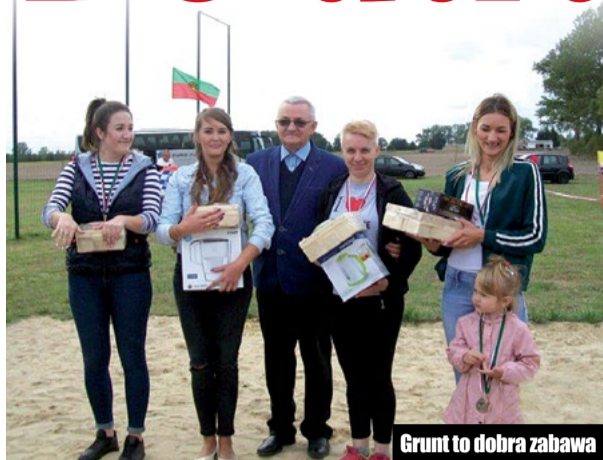
Grunt to dobra zabawa