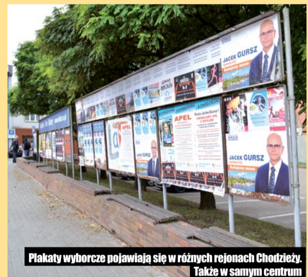
Plakaty wyborcze pojawiają się w różnych rejonach Chodzieży. Także w samym centrum