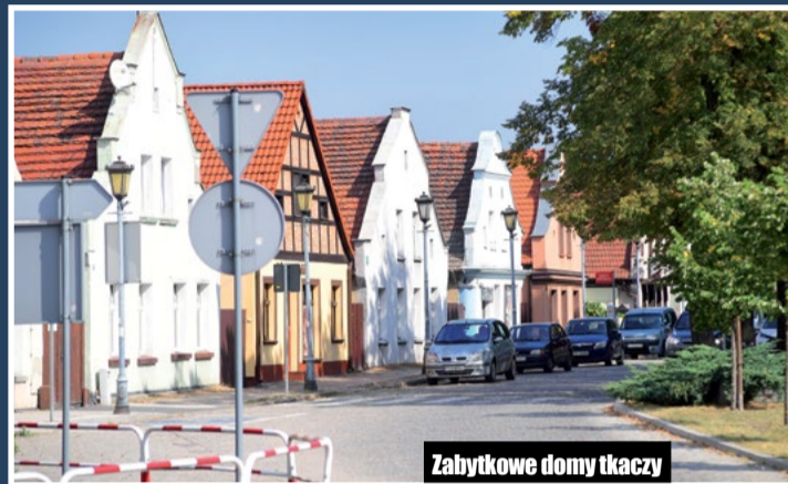
Zabytkowe domy tkaczy

„Aby Chodzież stała się atrakcyjna i przyjazna zarówno dla mieszkańców i przyjezdnych – zniesimy opłaty za parkowanie oraz za przejazdy komunikacją miejską. Skoro inne miasta już takie rozwiązania wprowadzają, wprowadzimy i my. Chodzież musi odbudować swoją pozycję i markę.”