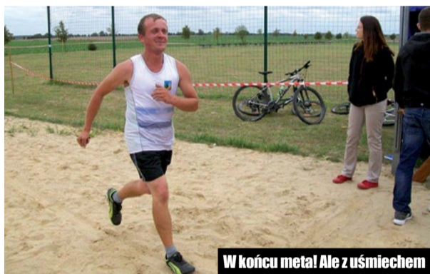
W końcu meta! Ale z uśmiechem