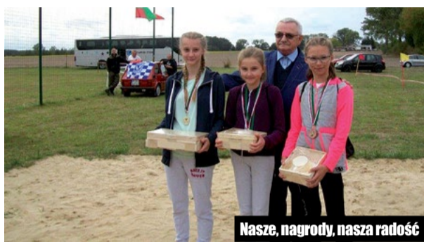
Nasze nagrody, nasza radość