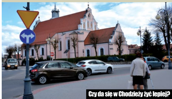
Czy da się w Chodzieży żyć lepiej?