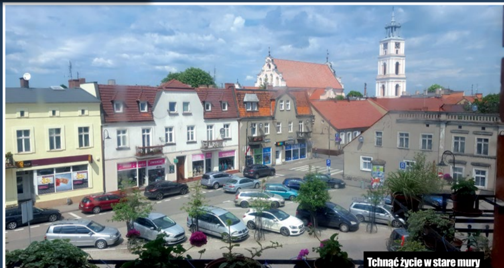
Tchnąć życie w stare mury