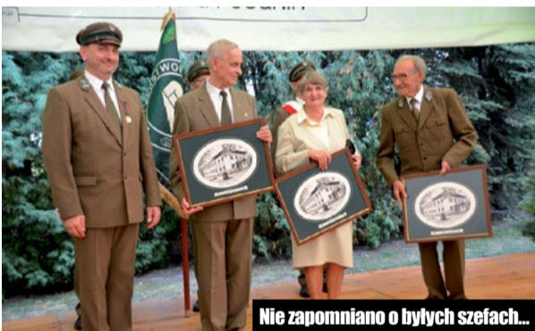
Nie zapomniano o byłych szefach...