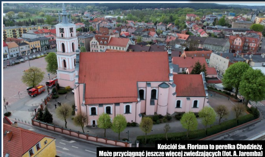
Kościół św. Floriana to perełka Chodzieży. Może przyciągnąć jeszcze więcej zwiedzających