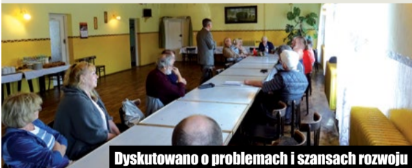
Dyskutowano o problemach i szansach rozwoju

Spotkanie członków KWW Ziemia Chodzieska z przedstawicielami władz Rodzinnych Ogrodów Działkowych przyniosło w ostatnim czasie konkretne rozwiązanie. Jednym z tematów poruszonych w rozmowach z działkowcami była kwestia przyłączenia się użytkowników działek do sieci energetycznej.