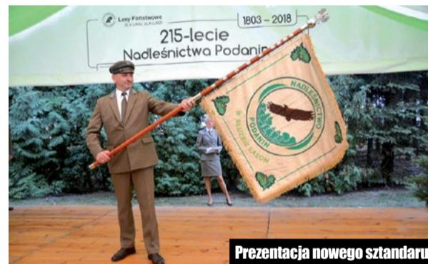
Prezentacja nowego sztandaru