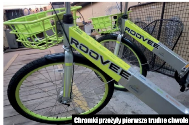
Chromki przeżyły pierwsze trudne chwile

dalej, przy ul. Kasprzaka jego kolegę. Bełkotliwa mowa, trudności z utrzymaniem równowagi oraz silnie wyczuwalna znana chyba wszystkim charakterystyczna woń wskazywała, że najprawdopodobniej znajdują się oni pod wpływem alkoholu.