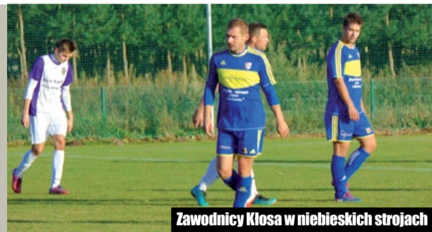
Zawodnicy Kłosa w niebieskich strojach

Kłós Budzyna podejmował na boisku w Stróżewie zespół Wenus Jędrzejewo. Niestety nie było to porównawcze wydarzenie. Pojedynek nie obfitował w akcje, mecz był wolny, dużo w nim było fauli i kłótni, mało dobrej gry.