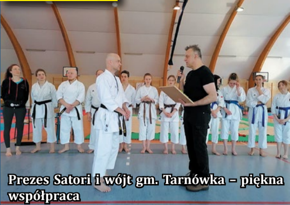
Prezes Satori i wójt gm. Tarnówka - piękna współpraca