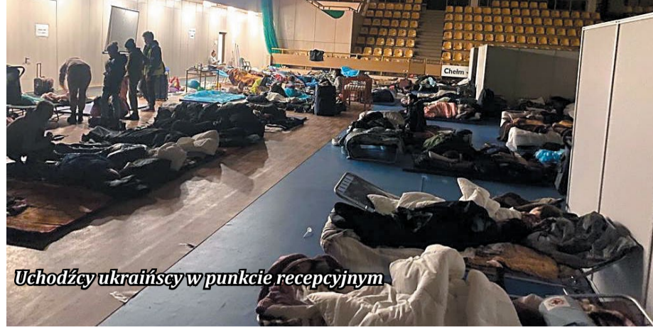
Uchodźcy ukraińscy w punkcie recepcyjnym

Wiadomo już kto wystąpi w tradycyjnym koncercie rozpoczynającym sezon letni w Margoninie. Artyści z reprezentacyjnego zespołu tanecznego „Słoneczko” Szkoły Sztuki Choreograficznej w Żytomierzu, już kilkakrotnie gościli w Margoninie. Tym razem zbierać będą fundusze na rzecz ukraińskiej armii. To nie jedyne wsparcie jakiego uchodźcom udziela społeczność i władze Margonina.