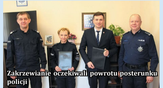
Zakrzewianie oczekiwali powrotu posterunku policji