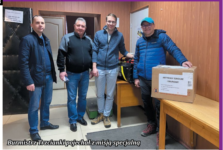
Burmistrz Trzcianki pojechał z misją specjalną

Miasto również w związku ze zwiększającym się napływem mieszkańców Ukrainy liczy także na rozwiązanie niedoborów perso-