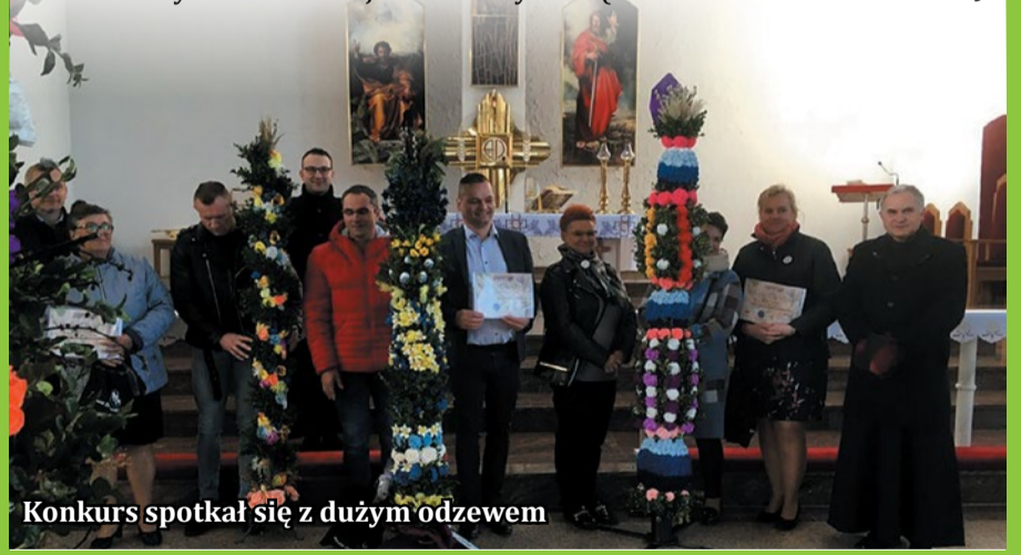
Konkurs spotkał się z dużym odzewem