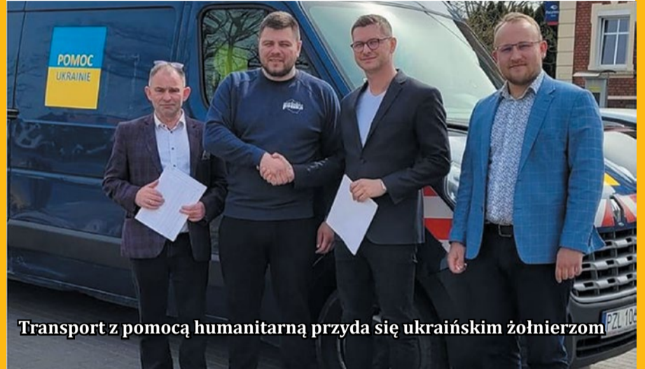
Transport z pomocą humanitarną przyda się ukraińskim żołnierzom