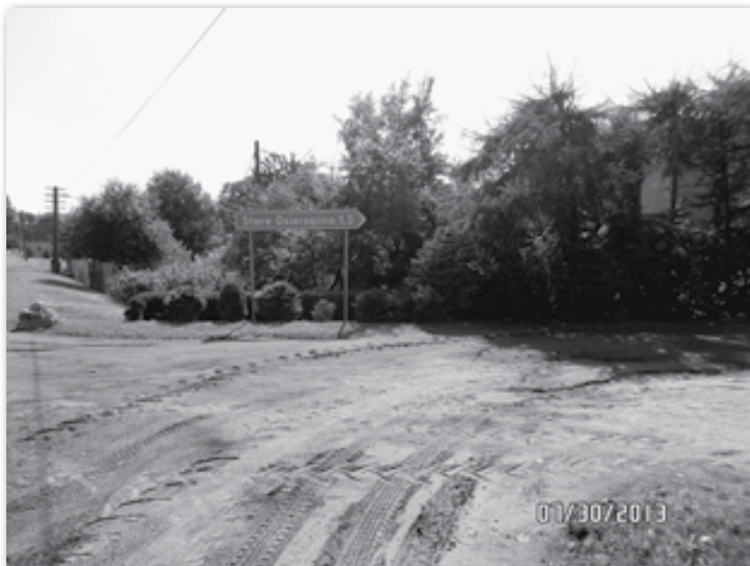
Rys. 5 Droga prowadząca ze Stawnicy do Starego Dzierżązna, którą w roku 1958 zbudowali w czynie społecznym gospodarze ze Stawnicy i Starego Dzierżązna.