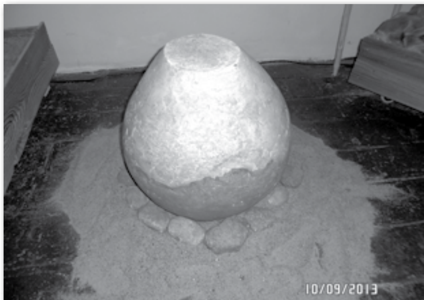
Rys.1 Grób popielnicowy z epoki brązu i żelaza.

Również odkryte w pobliżu drogi prowadzącej do „stawnickiego młyna” groby popielnicowe z epoki brązu i żelaza (stanowisko 4 i 9), świadczą o wcześniejszym istnieniu osadnictwa w tym miejscu.