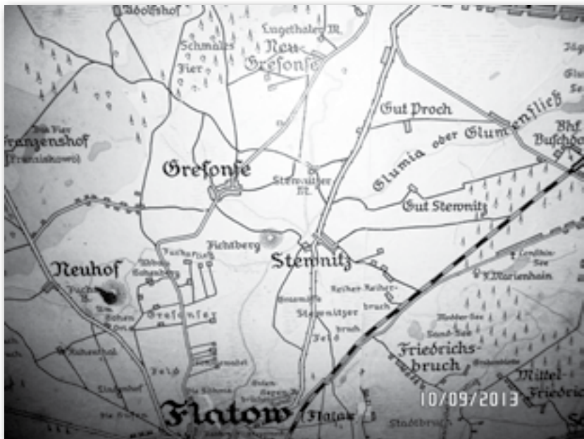
Rys.2 Fragment mapy powiatu Złotowskiego, 1:30000, prawdopodobnie z 1930 roku, znajdującej się w Muzeum w Złotowie.

Natomiast według Pruskiego Urzędu Statystycznego z dnia 1 Grudnia