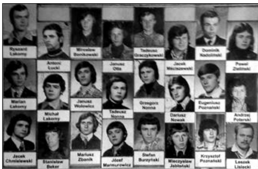
Kadra Zamku Gołańcz