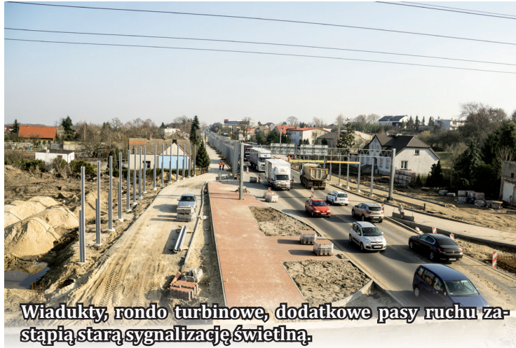
Wiadukty, rondo turbinowe, dodatkowe pasy ruchu zastąpią starą sygnalizację świetlną.