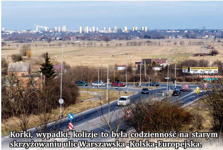
Korki, wypadki, kolizje to była codzienność na starym skrzyżowaniu ulic Warszawska-Kolska-Europejska.